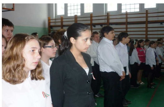
Eötvös József Tagintézmény