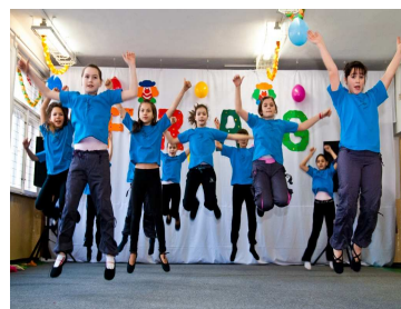
Vörösmarty Mihály Tagintézmény